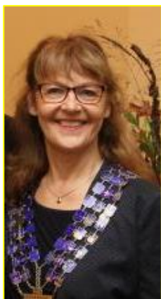
Gode ønsker Gudde Södergren Distrikt Guvernør Rotary Distrikt 1480

Held og lykke med at tjene andre, i en tid hvor nærvær og samvær skal udføres med omtanke.