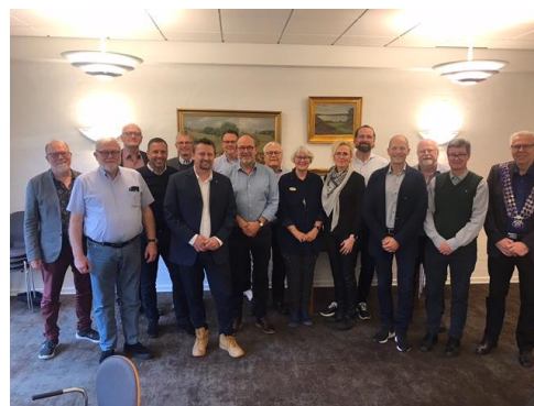
Hold af kursister på RLI efterår 2021, distrikt 1461