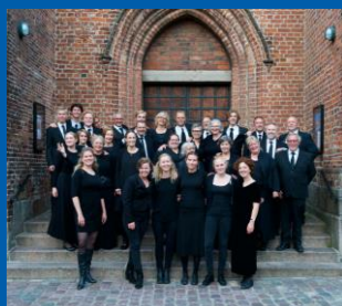
Vor Frue Cantori,