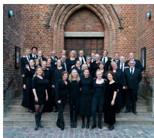
Vor Frue Cantori,