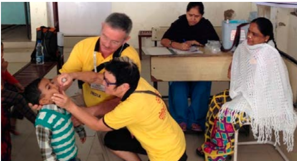
Rotarianere har deltaget aktivt med vaccination for polio.

Samarbejde om vaccine, håndtering, vaccinerings – udført af mange frivillige – er helt nødvendigt for at nå i mål og få en tryk hverdag. Erfaringen fra polio arbejdet er nu til gavn for bekæmpelsen af den aktuelle store pandemi.