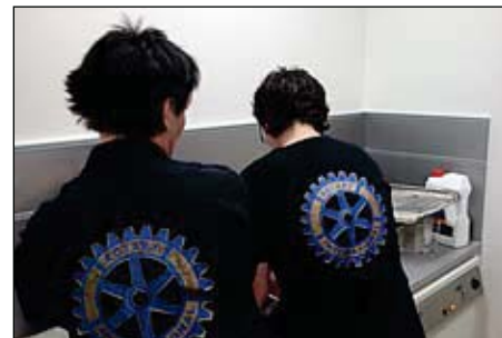
- Køkkenholdet - set fra den ene side ...

en computer, mikrofonanlæg og en skærm m.m. Alt i alt en rigtig god ordning med egne lokaler, hvor vi glæder os til at mødes hver onsdag aften under hyggelige former.