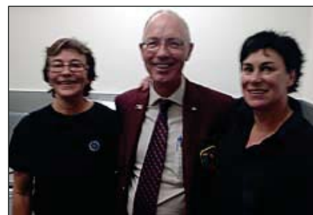
... og fra den anden side!