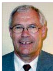
Af Per Hylander mentor Dronninglund Rotary Klub

Som omtalt i sidste nummer af Guvernørens Nyhedsbrev blev Hjallerup Morgen Rotary Klub chartret den 17. september med 25 nye energiske rotarianere, og flere er i skrivende stund på vej ind i klubben. Klubben blev en realitet efter knap et års ihærdigt og målrettet arbejde.