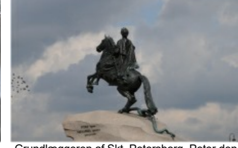
Grundbyggen af Skt. Petersborg, Peter den Store. Skt. Petersborgs mest berømte statue