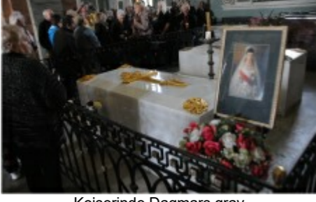
Køperens Dagnars grav