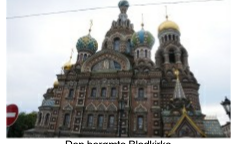
Den berømte blodkirke