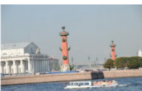
De to gamle fyrterne ved Marinemuseet