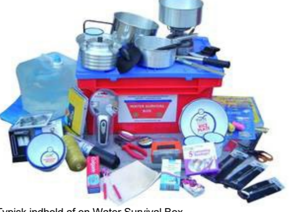
Typisk indhold af en Water Survival Box