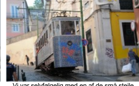
Vi var selvfølgelig med en af de små stejle sporvogne

Når nu vi var så langt som Lissabon, så var det jo oplagt at tage et smut til den skønne grønne e Madeira: