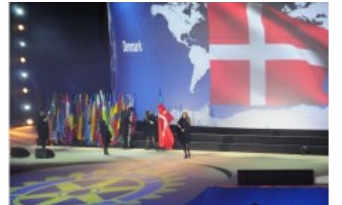
Danmærg bærer ind under åbningen

Ud over de mange spændende indlæg og præsentationer, hvor man virkelig finder ud af, hvor mangfoldig Rotary er, og hvor stor en fordel det er at have mange forskellige måder mange steder i verden, så er House of Friendship også en vigtig del af et RI Convention. I flere haller kan du finde boder og udstillinger for Rotary Fellowships, Rotary Artion Groups, Rotary projekter og en markedsplads, hvor du kan købe alle former for Rotary relaterede varer i form af mærker, emblemer og beklædning.