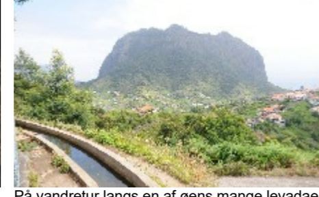
På vandretur langs en af øens mange levende vandveje