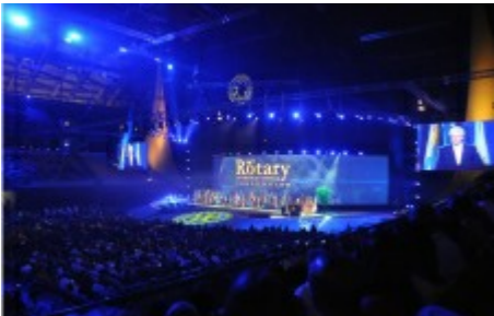
Åbningsceremonien af et imponerende show