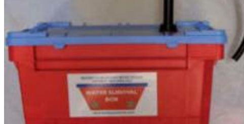
Her ses kassen med varemærkeskiltet

Det er mit håb, at rigtig mange klubber og rotarianere i distrikt 1480 vil være med til at hjælpe filippinerne på denne måde.