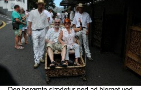
Den berømte stædtur ned ad bjerget ved Monte