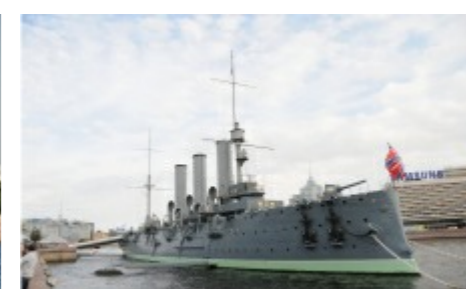
Skibet Aurora, der startede den russiske revolution med et skud fra den første kanon