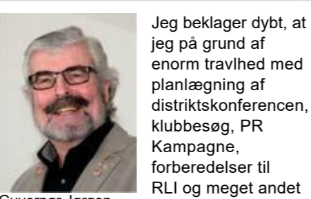
Guvernør Jørgen Windfeldt

Fremover skulle de meget gerne komme hver måned.