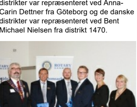
GSE-mødet om den danske nation