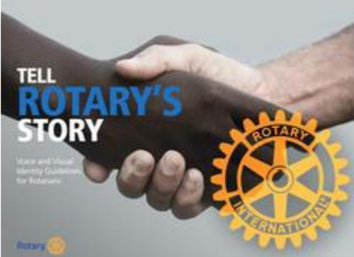
Her er forsiden til den spændende præsentation af Rotarys nye branding

Hvis du vil vide mere om undersøgelsen Strengthening Rotary, der ligger til grund for de nye initiativer, så klik her.