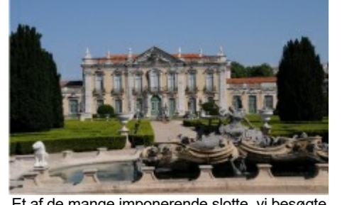
Et af de mange imponerende slotte, vi besøgte