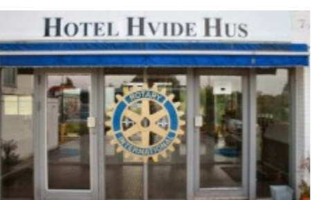
Årets distriktskonference blev afholdt d. 5. oktober på Hotel Hvide Hus i Høje.