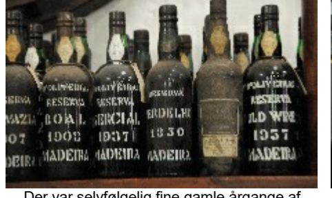
Der var selvfølgelig fine gamle årgange af øens berømte øsseltvin, Madeira

Når nu vi var så langt som Lissabon, så var det jo oplagt at tage et smut til den skønne grønne e Madeira: