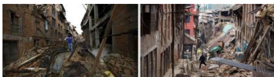
De frygtelige ødelæggelser i Nepal

Nepal har en befolkning anslået til ca. 30 millioner mennesker og landet er meget fattigt, og der forestår nu et næsten uoverskueligt genopbygningsarbejde. Som Rotarianer spørger man uvilkårlig sig selv: "Kan Rotary gøre noget"?