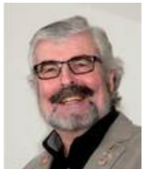
Guvernør Jørgen Windfeldt

Det vil være en forudsætning for, at klubben på det lokale plan får det optimale udbytte ud af hele kampagnen