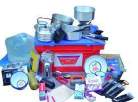
Typisk indhold af en Water Survival Box