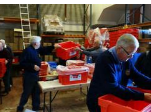
Rotarianere fra den engelske Rotaryklub har travlt med at pakke boksene.