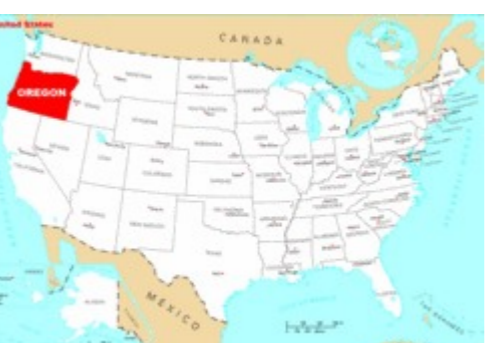
Klik på kortet for en større udgave