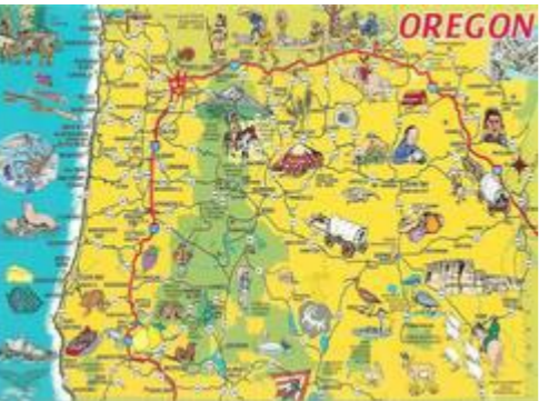
Klik på kortet for en større udgave