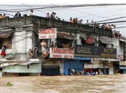
Filippinerne • Foto: Purnaji News Worldwide