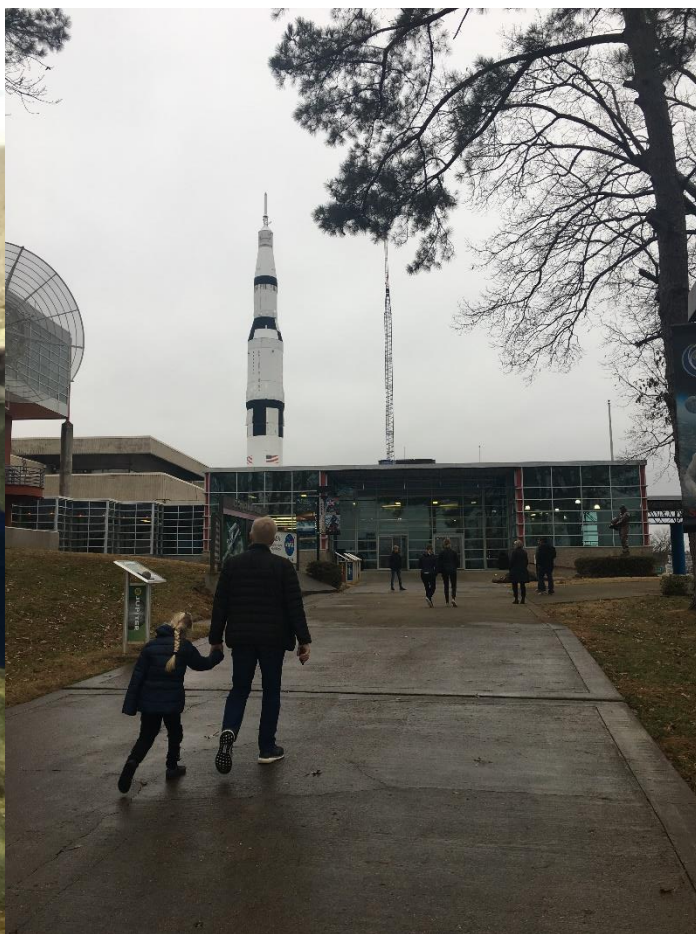
Billeder fra families tur til hhv. Tennessee Aquarium i Chattanooga og U.S. Space & Rocket Center I Huntsville