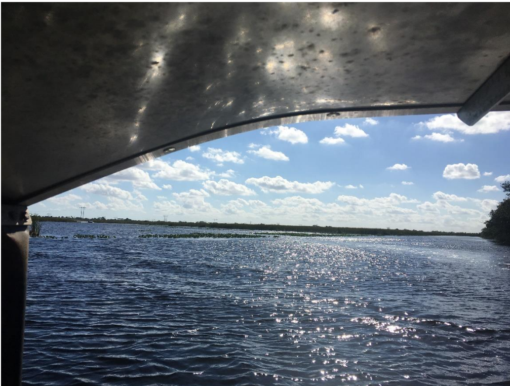
Billeder fra the Everglades I Florida