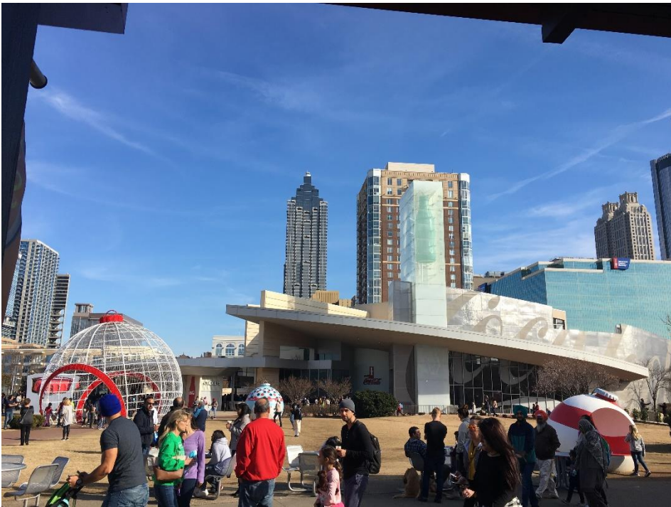
Coca-Cola Museet | Atlanta