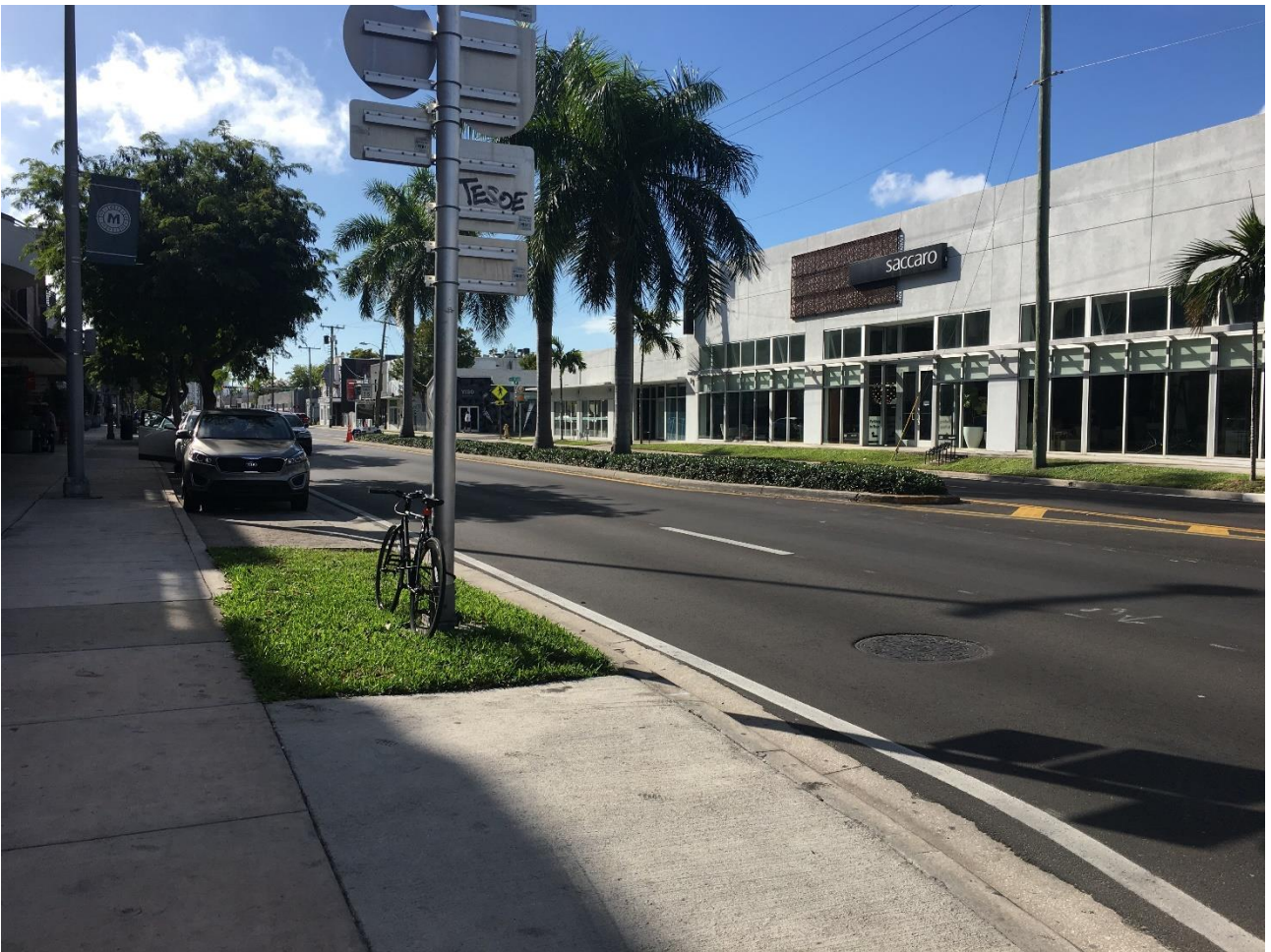
Billeder fra Miami, Florida