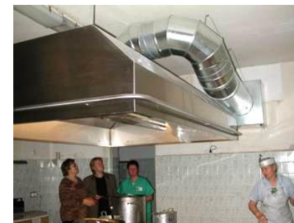
"Lopselis", et af de store emfang 2003. 2)

Badet stod færdigt i foråret 2003 med tilhørende toilet- og omklædningsfaciliteter. Det betød et løft i behandlingen af både "Lopselis" egne børn og de mange små ambulante patienter.