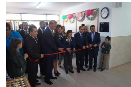
Snoren klippes af honoratiories til ret tyrkisk skole i 2015.