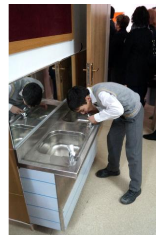
"Turkoglu", en af drikkevandsfontænerne 2014. 6)

Siden 2011 har Projektudvalget lagt sine kræfter i Tyrkiet, nærmere bestemt skoleprojekter i Mamak, en fattig forstad til Ankara. I samarbejde med RC Ankara-Anittepe og andre tyrkiske rotaryklubber har vi så at sige specialiseret os i at renovere og opgradere skolebygninger for at give børnene et større udbytte af deres skolegang og dermed bedre muligheder i det tyrkiske samfund. I september 2012 indviede vi "Harmanyolu-skolen" med næsten 300 lærere og elever, og i februar 2014 var det flere end 500 elever og lærere, der fik deres "Turkoglu-skole" tilbage i en ny skikkelse. I begge tilfælde var der tale om "Global Grants".