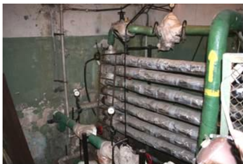
"Lopselis", det gamle centralvarmeanlæg 2007. 3)

I 2008 indviedes efter et langt og sejt projektarbejde - igen i samarbejde med Kauno Rotary Klubas - et imponerende elevatortårn i glas, der bandt hovedbygningens 4 etager sammen. Det ændrede hverdagen på "Lopselis" radikalt: Nu kunne bårer, senge og kørestole let flyttes rundt i bygningen - ligeså børnene og maden fra køkkenerne! Et "Matching Grant" udgjorde rygraden i projektet, der også rummede et bidrag fra Lemvig RK; men ANVR's eget bidrag var markant – og et tilknyttet projekt, som omfattede en modernisering af "Lopselis" centralvarmeanlæg, bekostedes 100% af ANVR og et litauisk advokatfirma.