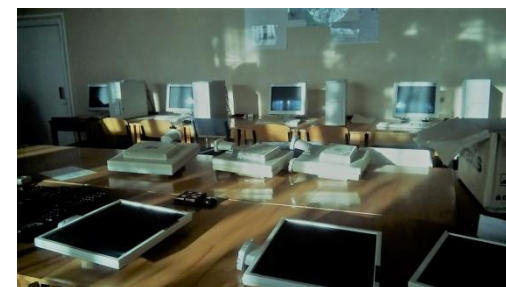
Computerrum under etablering på skole i Ukraine i 2017.