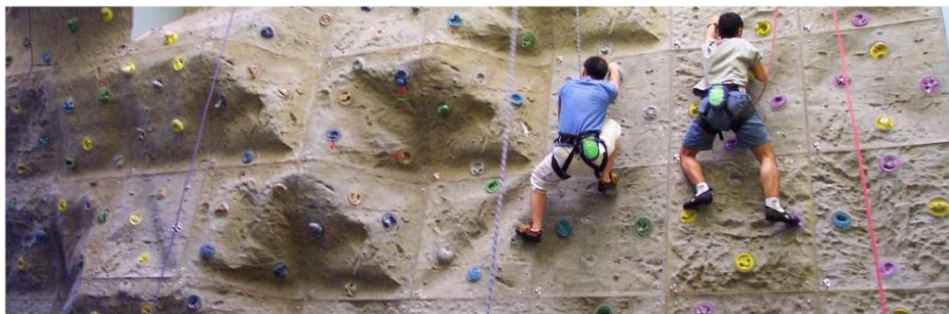
Klatrevæg i Celle. 10)

Fra 2014 indgik ANVR i et projektsamarbejde med sin mangeårige venskabsklub, RC Celle i Tyskland. Her er der ikke tale om et "Global Grant", men derimod om flere "District Grants". Temaet var imidlertid det samme: udsatte børn og unge, denne gang i Tyskland og Danmark.