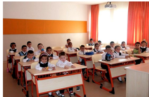
"Harmanyolu", et af de nye klasseværelser 2012. 5)

Siden 2011 har Projektudvalget lagt sine kræfter i Tyrkiet, nærmere bestemt skoleprojekter i Mamak, en fattig forstad til Ankara. I samarbejde med RC Ankara-Anittepe og andre tyrkiske rotaryklubber har vi så at sige specialiseret os i at renovere og opgradere skolebygninger for at give børnene et større udbytte af deres skolegang og dermed bedre muligheder i det tyrkiske samfund. I september 2012 indviede vi "Harmanyolu-skolen" med næsten 300 lærere og elever, og i februar 2014 var det flere end 500 elever og lærere, der fik deres "Turkoglu-skole" tilbage i en ny skikkelse. I begge tilfælde var der tale om "Global Grants".