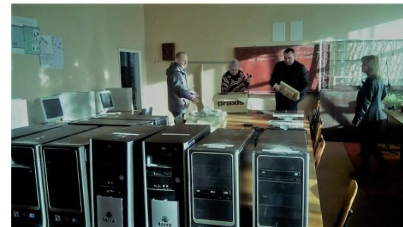
Fordeling af computere i Ukraine 2017. 9)

ANVR slog øjeblikkeligt til og riggede efterfølgende et "Global Grant" op med støtte fra RC Köln-Ville, Lemvig RK og Rotary Danmarks Hjælpesfond.