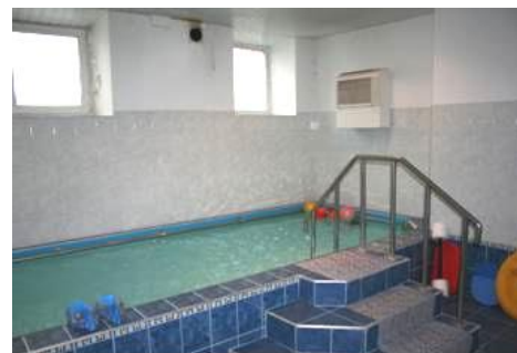
"Lopselis", det terapeutiske bad 2003. 1)

I 1990'erne og frem til 2008 var indsatsen koncentreret om børnehjemmet "Lopselis" ("vugge") i Kaunas, Litauens næststørste by. "Lopselis" var - og er - ikke blot et hjem for forældreløse og handicappede børn, men også en forskningsbaseret institution for handicappede børn og deres forældre fra hele Litauen. En række mindre, men værdifulde projekter omfattende tøj, legetøj, senge, køkkeninventar m.m. i 1990'erne førte i 2001 til, at ANVR i samarbejde med Kauno Rotary Klubas etablerede et egentligt hjælpeprojekt - et såkaldt "Matching Grant". Den umiddelbare anledning var "Lopselis" store ønske om et terapeutisk badebassin.