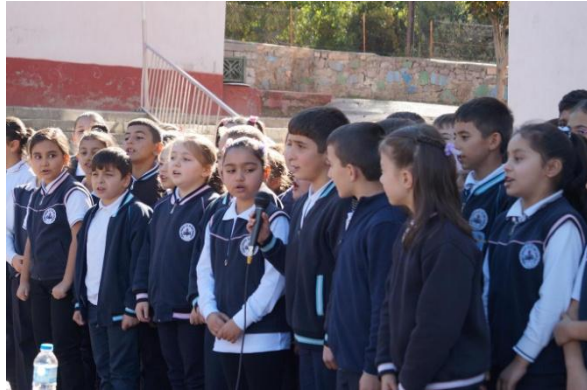
"Kösklüdere", forventningsfulde elever 2015. 7)

I 2015 var turen kommet til " Kösklüdere-skolen " og dens 625 elever. Opgaven var lidt større denne gang, fordi bygningernes stand var dårligere, end vi var vant til; til gengæld støttede ikke færre end 8 tyrkiske rotaryklubber op om dette "Global Grant" projekt, og resultatet blev godt.