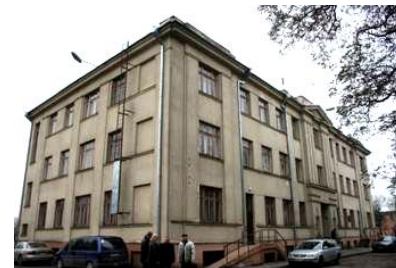
Børnehjemmet "Lopselis", hovedbygningen 2002.

I 1990'erne og frem til 2008 var indsatsen koncentreret om børnehjemmet "Lopselis" ("vugge") i Kaunas, Litauens næststørste by. "Lopselis" var - og er - ikke blot et hjem for forældreløse og handicappede børn, men også en forskningsbaseret institution for handicappede børn og deres forældre fra hele Litauen. En række mindre, men værdifulde projekter omfattende tøj, legetøj, senge, køkkeninventar m.m. i 1990'erne førte i 2001 til, at ANVR i samarbejde med Kauno Rotary Klubas etablerede et egentligt hjælpeprojekt - et såkaldt "Matching Grant". Den umiddelbare anledning var "Lopselis" store ønske om et terapeutisk badebassin.