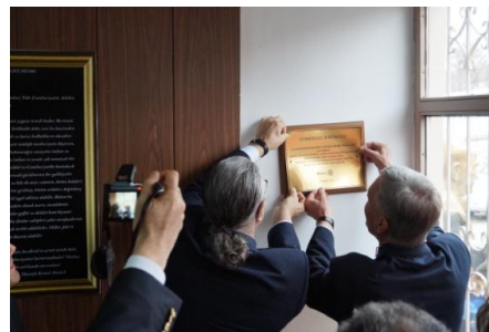
Tyrkisk distriktsguvernør og dansk projektleder sætter Rotary plaketten op på renoveret skole i 2014.

ANVR's store projekter er gennemført som "Matching Grants" og fra 2010 som "Global Grants", dvs. med tilskud fra rotarydistriktet (District Designated Fund) og Rotary Foundation (World Fund), der kan matche klubbidrager henholdsvis 1:1 og 0,5:1. Mindre projekter er gennemført som "District Grants", dvs. med tilskud fra rotarydistriktet (DDF), der kan matche klubbidrager 1:1. Øvrige projekter er finansieret 100% af ANVR og private bidragydere.