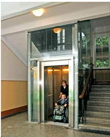
"Lopselis", elevatoren 2008. 4)

Det store elevatorprojekt blev afslutningen på klubbens mangeårige engagement i Litauen, men ANVR bevarer kontakten både til "Lopselis" og de mange litauiske rotarianere i Kauno Rotary Klubas. Således foretog 12 af ANVR's medlemmer med ægtefæller i maj 2016 et vellykket "eftersyn" på "Lopselis" med efterfølgende besøg i Kauno Rotary Klubas.