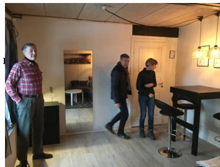
Værested istandsat, malet og møbleret af pigegruppen i Tilst 2016.