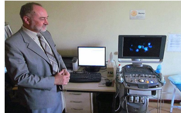
Hospitalet i Kiev, hjerneskaneren 2014. 8)

I 2016 viste der sig mulighed for at købe ca. 600 computere med tilhørende udstyr fra en amerikansk luftbase i Tyskland. Den Multinationale Rotaryklub i Kiev og