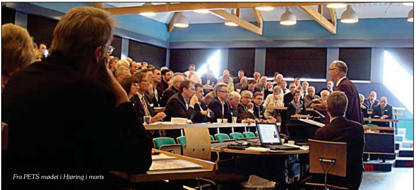
Fra PETS mødet i Hjørring i marts