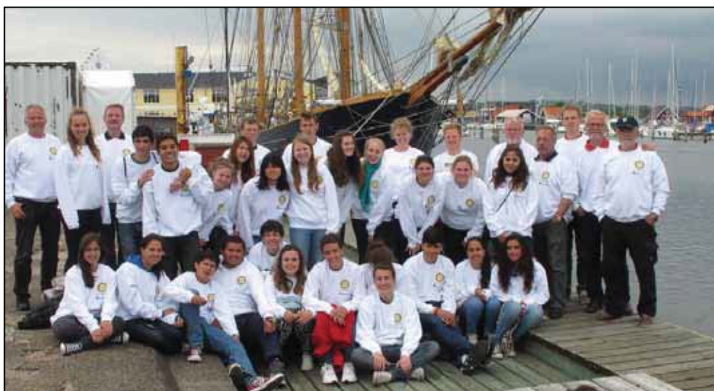
Sæby havn Udvekslingsstudenter og besætning på YLX 2012 – her i flot opstilling på havnen i Sæby.