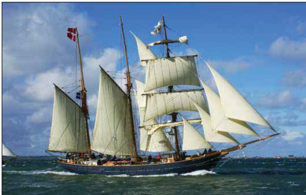
Her er "LOA i Limfjorden".

9/6: Randers 10/6: Hobro 11/6: Frederikshavn 12/6: Skagen 13/6: Hals 14/6: Aalborg (Honnørkajen)