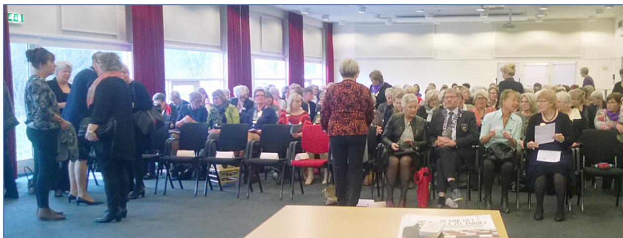
En talstærk forsamling var samlet til forårsdistriktsmøde i Inner Wheel i Aalborg