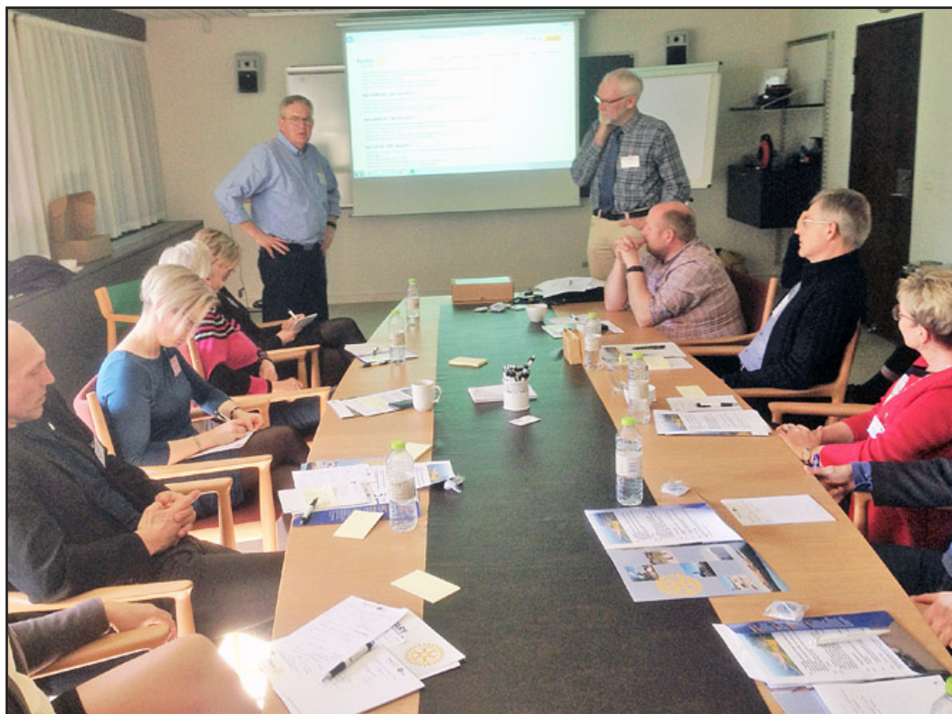
Ideer og erfaringer med projekter blev diskuteret.