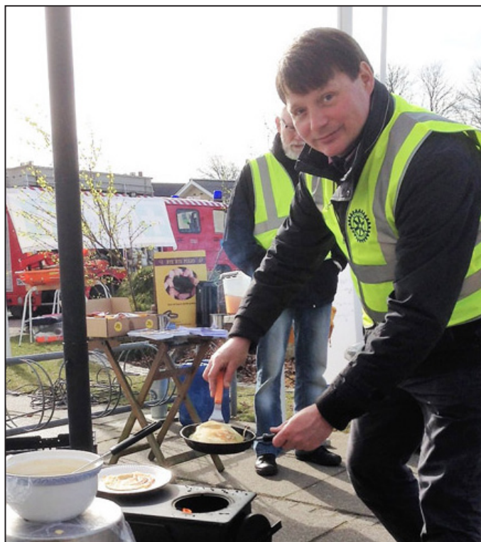
Messe Fjerritslev og Pandekager