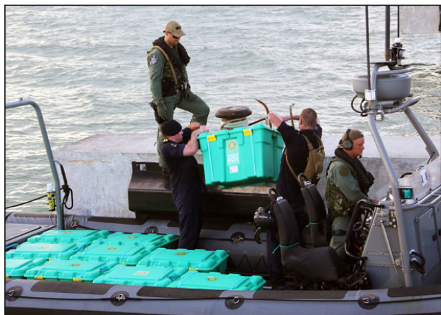
Her distribueres ShelterBoxe ved den seneste naturkatastrofe på Haiti.