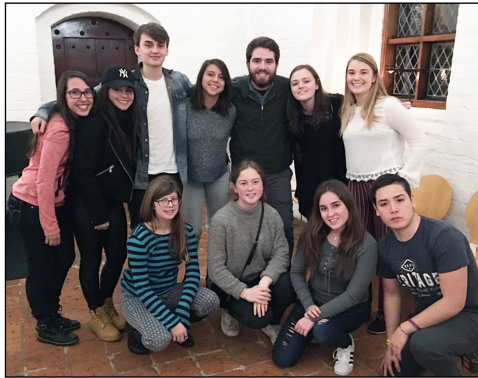
11 udvekslingsstudenter deltog i julegudstjenesten i Aalborg.