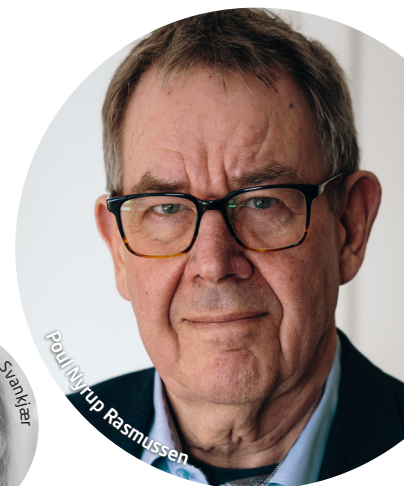
Poul Nyrup Rasmussen