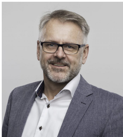
POUL DUE JENSEN / GRUNDFOS FOUNDATION