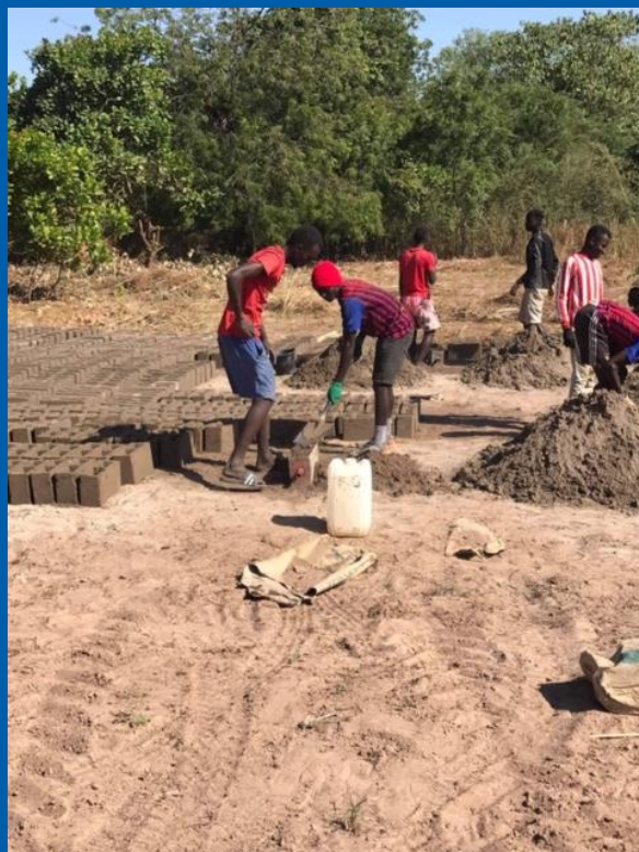
3 teams af unge mænd støber cementblokke til brug for fundament til hegn

Fremdrift i projektet vil kunne følges på FC gruppen "Galloya – a Gambian village in progress", som man kan søge om optagelse i.