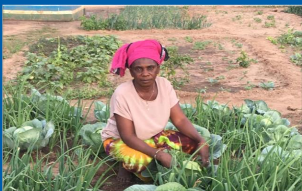
Billede fra den første have

Projektet vil derfor have enorm betydning for ernæring, sundhed og levestandard i landsbyen, som tæller ca. 800 indbyggere.