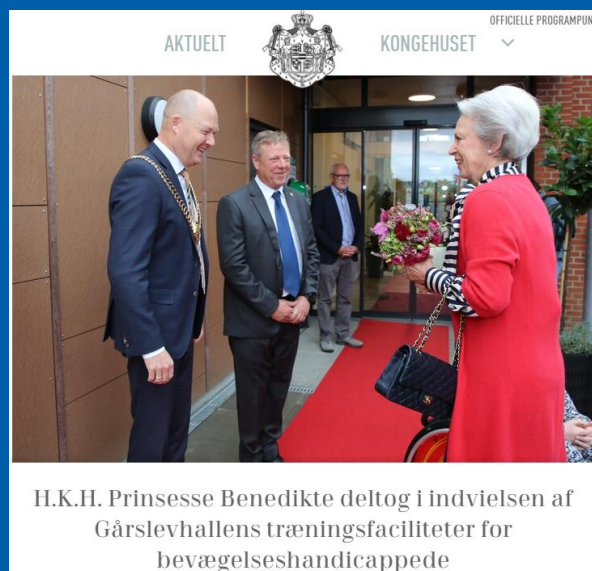
H.K.H. Prinsesse Benedikte deltog i indvielsen af Gårslevhallens træningsfaciliteter for bevægelsehandicappede