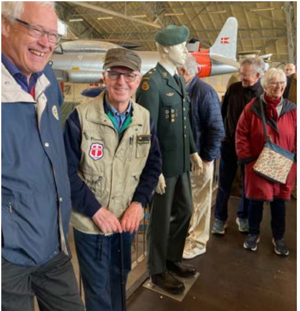
Besøg på Forsvars- og Garnisonsmuseet