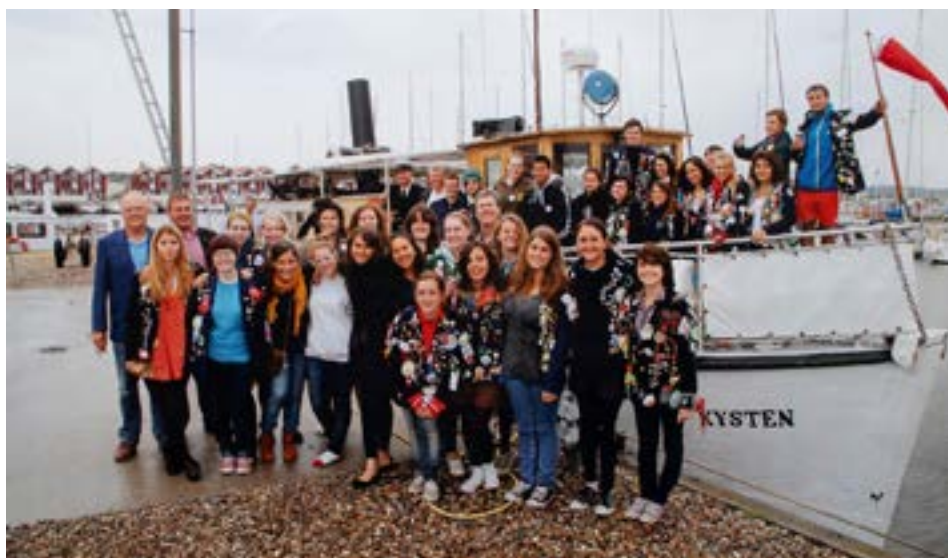
Første sejlhold tilbage i 2008.