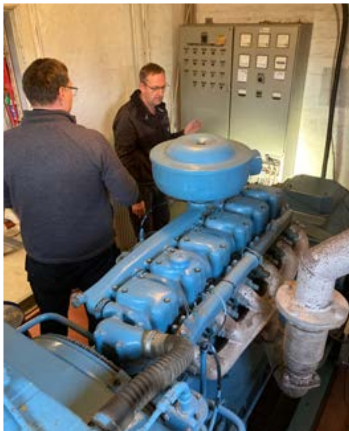
Generatoren inspiceres og prøvekøres. Den skulle ud igennem muren i baggrunden.