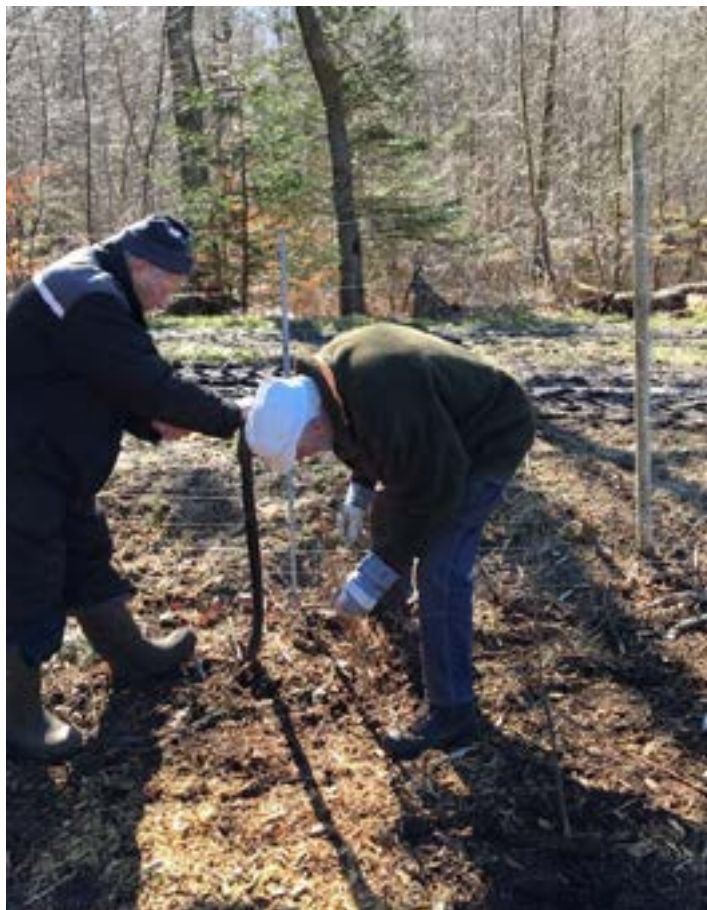
To af klubbens medlemmer i gang med træplantning.