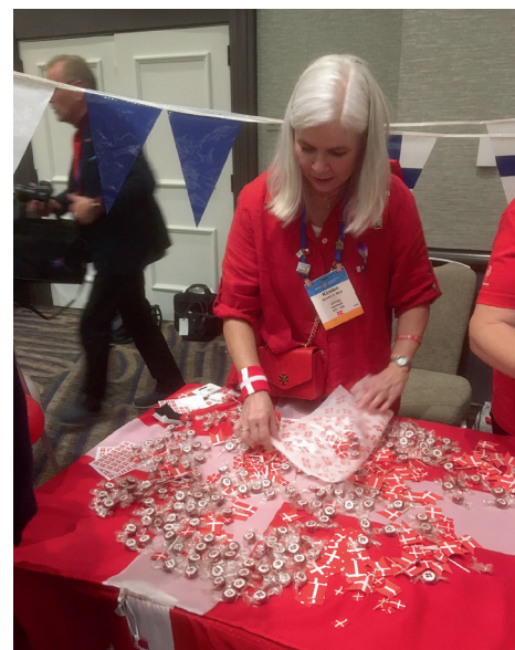
Fra vores Kultur dag

Ikke mindst er det vigtigt, at klubberne analyserer, hvorfor medlemmer siver ud efter blot få år i klubben? Hvorfor der ikke er den tilgang af nye medlemmer i den strøm, som man gerne så? Måske skal klubben vende spejlet mod