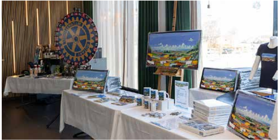
De tre Rotaryklubber i Frederikshavn er gået sammen om en storstilet indsamling til fordel for SMILfonden med salg af flotte kunstarkiver, der kan købes online på rotary-shop.dk