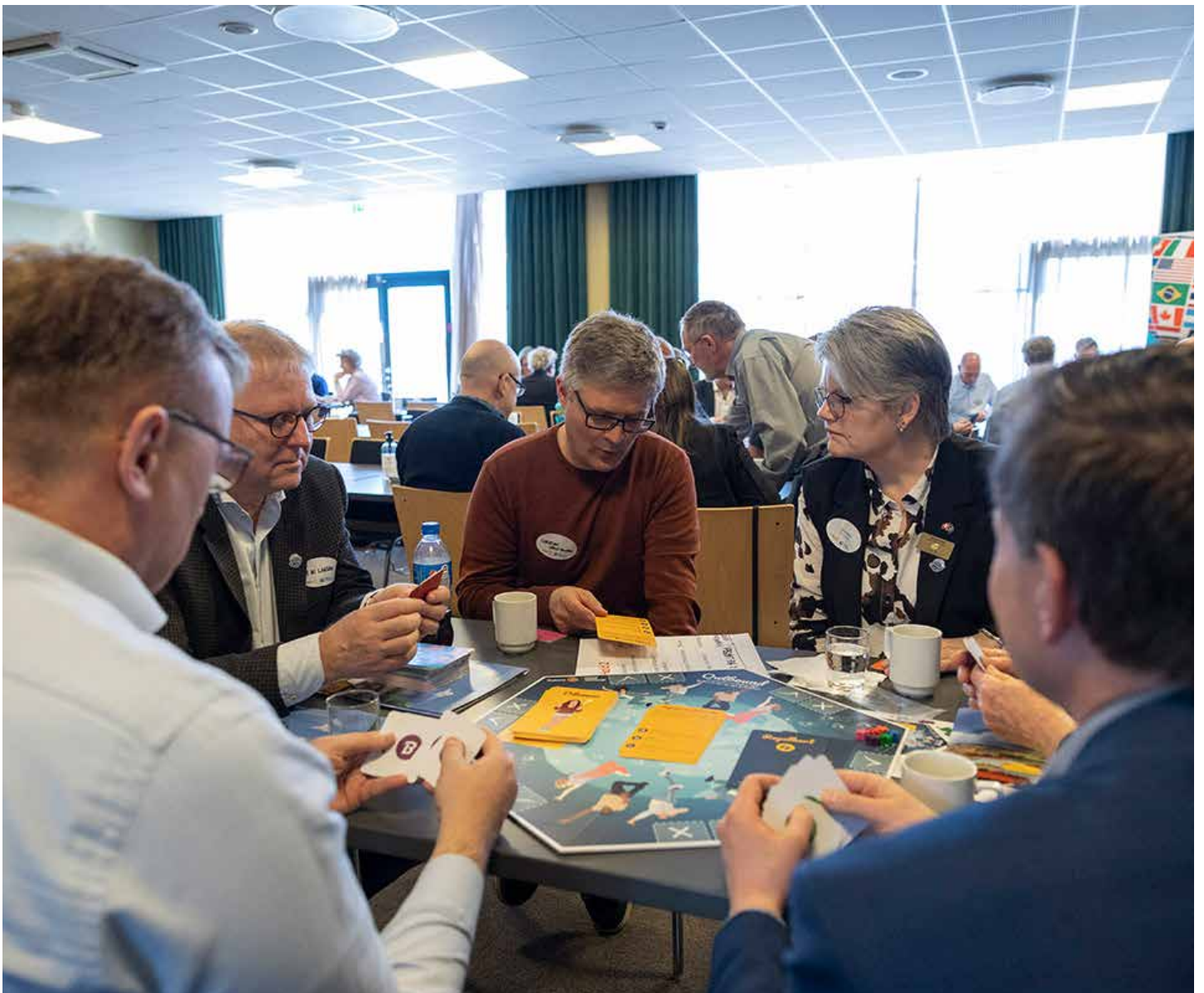
Outboundspillet gav god dialog blandt deltagerne i ungdomsprogrammet.

Tak for en flot planlagt god dag med fællesskab, hygge, underholdning, netværk og den gode vilje til at gøre en forskel for andre i en rotariansk ånd.