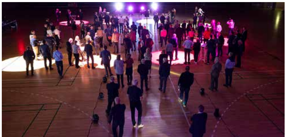
EUC Nord uddanner ca. 20 eventteknikere om året til oplevelsesbranchen. Eleverne på eventtekniker-uddannelsen, der blev født og udviklet i Frederikshavn i 2007, havde forberedt et flot show for de mange rotarianere, der besøgte Frederikshavn.