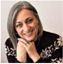
Af Nidal Seide Dronninglund Rotary Klub

Lørdag d 19.marts blev der holdt obligatorisk YEO seminar. Dagen var begivenhedsrig med oplæg og afklaringer for bl.a. PO og CC i distriktet. Seminaret indeholdt oplæg omkring praktiske procedure, frister og gode råd til håndtering af vores kommende in- og outbounds.