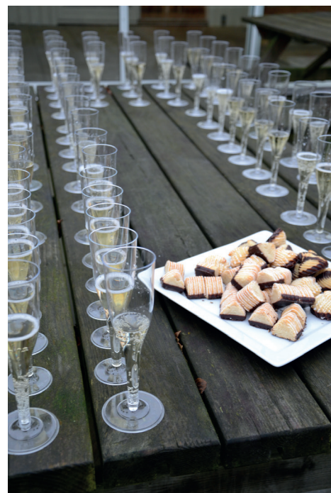
Efter traveturen var der bobler og kransekage...

at høre mere, vil jeg meget gerne ud- dybe projektet for interesserede.