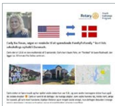
Eksempel på opslag omkring Family-to-Family

I Rotary har vi mange muligheder for ungdomsudveksling, men de færreste kender til mulighederne for Short Term Exchange. En mulighed for de unge mennesker er enten at komme på udveksling med et andet ungt menneske i en familie i udlandet og få deres barn retur i 3-6 uger (Family-to-Family) eller rejse ud på eventyr med 20-25 andre unge med fokus på fællesskabet og oplevelser af forskellig karakter (Camps).