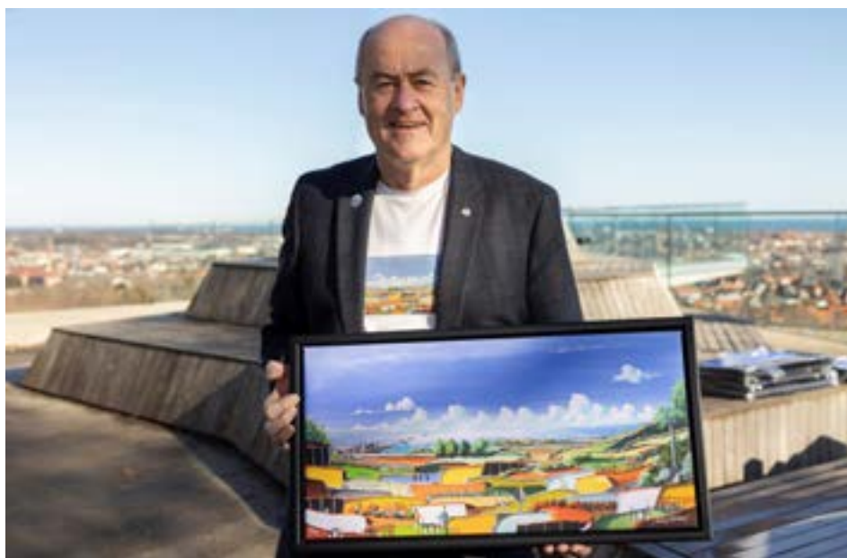
Der bliver lejlighed til på messen at købe ting til fordel for SMIL-Fonden.

Al overskud ved Rotary's medvirken går ubeskåret til SMILFonden. SMILFonden med stifteren Sisse Fisker i front er en velgørende forening, der støtter børn med særdeles alvorlig kronisk sygdom. Fon-