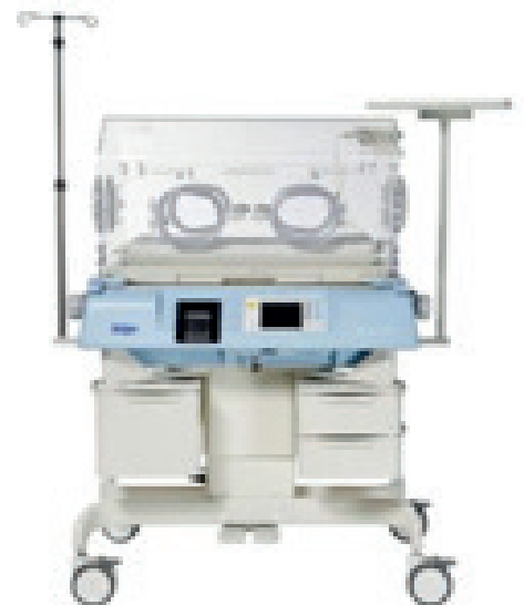
Isolette 8000 plus