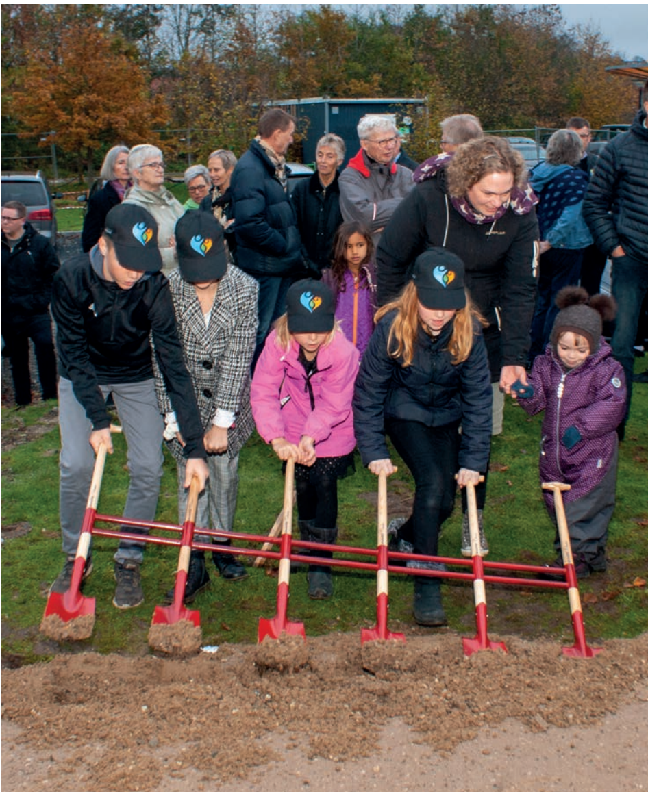
Den specielt til lejligheden fremstillede spade satte byggeriet i gang.

Fællesprojektet for klubberne i de vstdanske distrikter 1440, 1450 og 1461