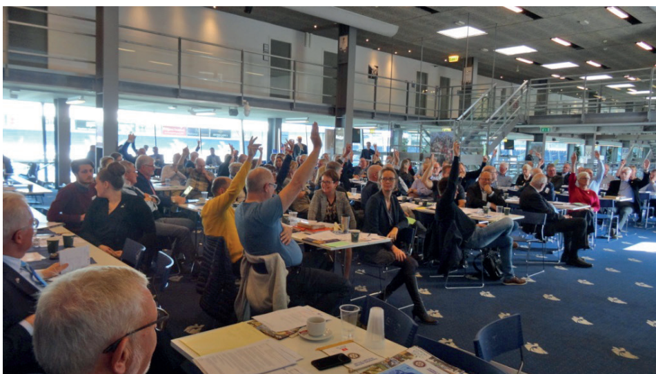
Med 120 deltagere var der god tilslutning til årets distriktskonference.