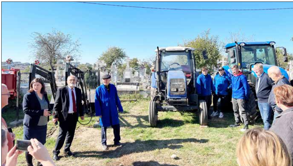
Landbrugsskolen i Iasi har gennem to årtier leveret praktikanter og arbejdskraft til Himmerland. Der er ingen dyr og kun lidt jord til de ikke helt topmoderne traktorer at pløje på.