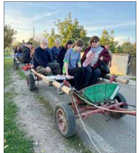
Gruppen fra Rotary Aars fik en autentisk oplevelse på besøg i Rumænien, hvor hestevognskørsel ikke er noget, man skal betale ekstra for.