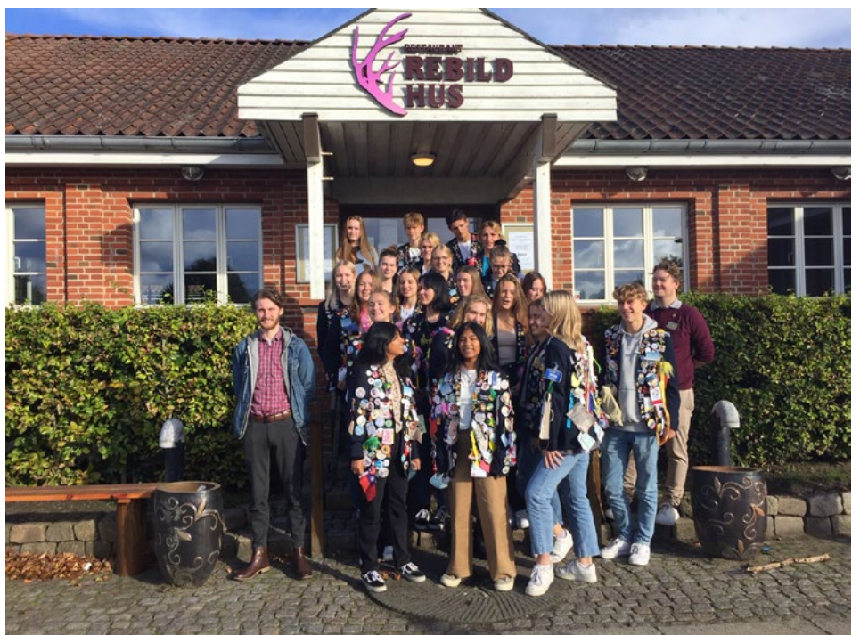
Udvekslingsstudenterne, der deltog i Afterbriefing.