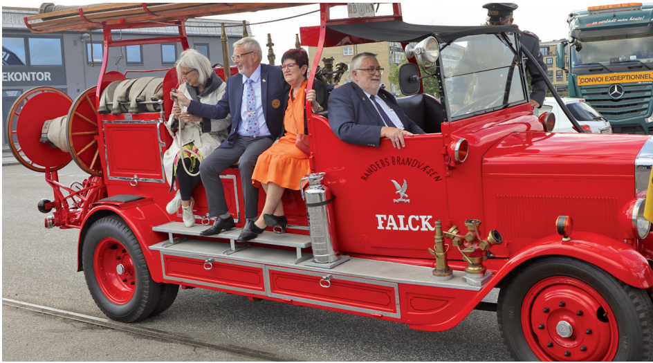
Ankomst til kædeoverrækkelses festen.