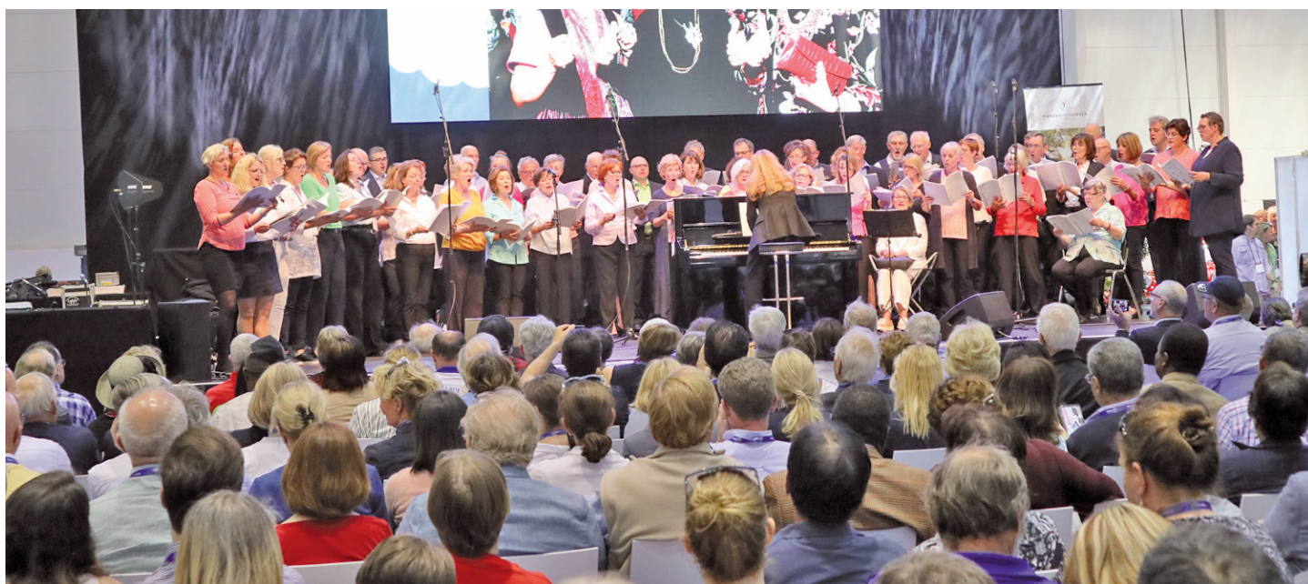
Et kor fra tysk Rotary underholdt ved åbningsceremonien.

Flere oplægsholdere fremhævede, at nye medlemmer skal kunne føle sig velkomne, og det gør de især, hvis der