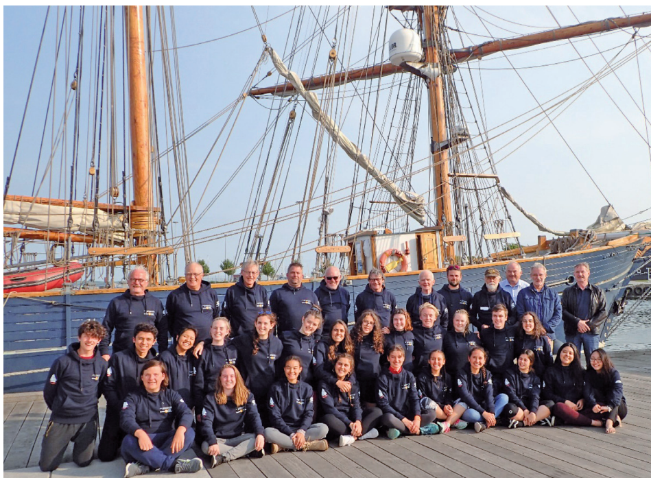
Årets sejlads med LOA var igen en stor succes og en god oplevelse for udvekslingsstudenterne.