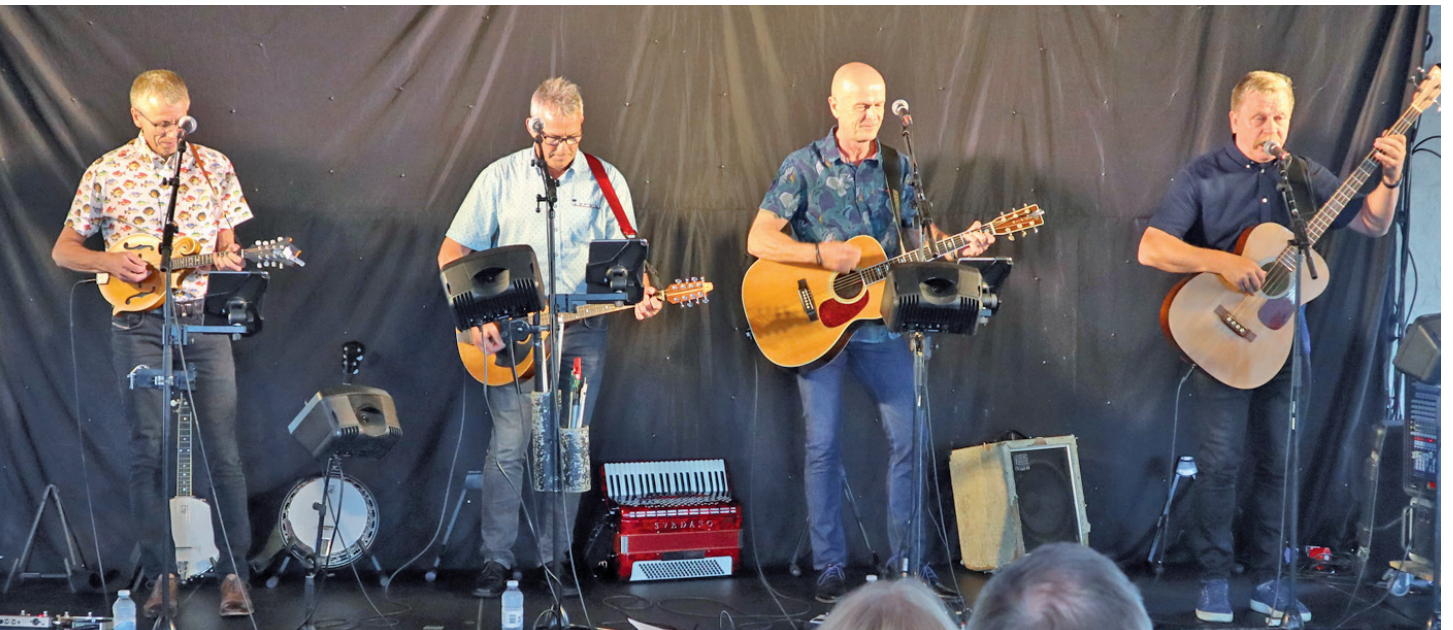
Tørfisk leverede fin underholdning.