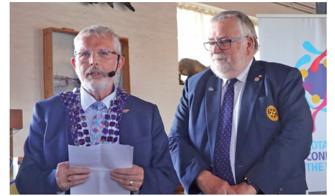
Den nye guvernør takker den afgående.