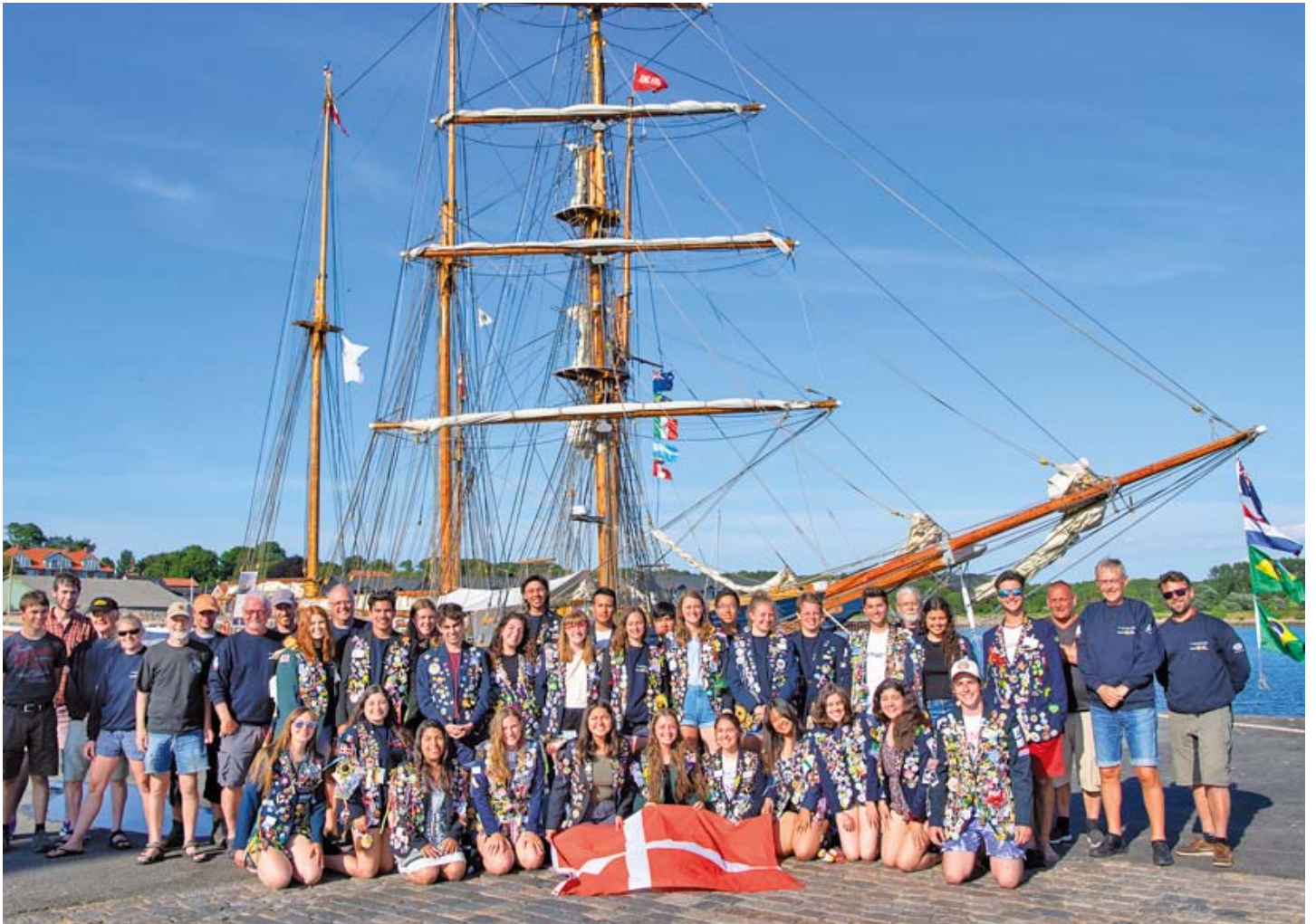
Det officielle billede af deltagere – besætning og gaster – ved Rotary-Togtet 2018.

Rotary-togtet 2018 på Limfjorden med distriktets udvekslingsstudenter foregik i uge 23 med afgang fra Aalborg søndag den 3. juni og tilbage i Aalborg den 9. juni. Fra Aalborg gik togtet til Løgstør og videre herfra til Struer, Thisted, Nykøbing Mors, Fur og tilbage til Aalborg.