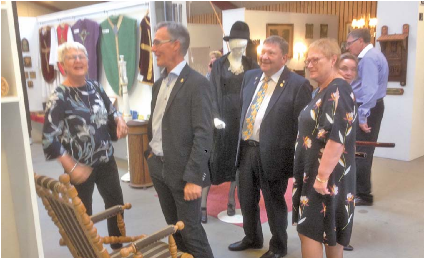
Gensyn med tidligere tiders mode gav anledning til muntre minder:

Afgående og tiltrædende guvernør ankom til aftenens fest på Aars Hotel i en fornem Mercedes, efterfulgt af deres fruer i en cabriolet. Her blev de modtaget af en talrig forsamling