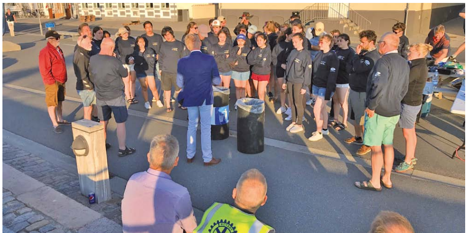
Vesthimmerlands Borgmester giver velkomst til udvekslingsstudenterne ved spisningen på Dronningekajen.

ninger på de to skibe samles hver aften inden sengetid for at lære at synge sangen "Blæsten går frisk over Limfjordens vande". Studenterne i år var særlig gode og lærenemme til at synge. Hurtigt fangede de melodien, og teksten blev grundlag for samtaler om geografi,