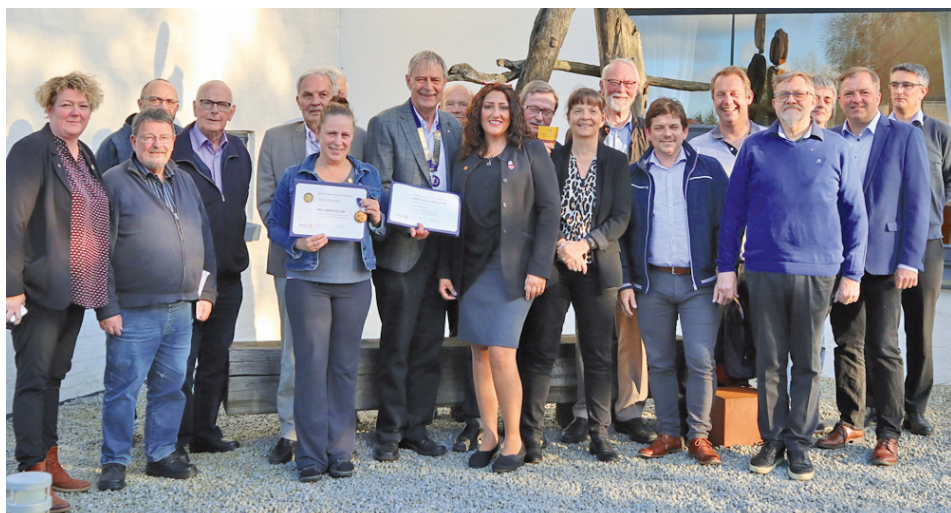
Glæde og stolthed i Han Herred Rotary Klub over tildelingen af "Certificate of Appreciation" og et personligt PHF.

beløb for hver booking til sin virksomhed, Hotel Klitrosen i Slettestrand. Det er indtil videre blevet til 1.000 US $ til polio-projektet.