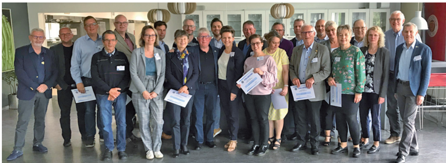
Deltagerne ved afslutningen af RLI nr. 12.