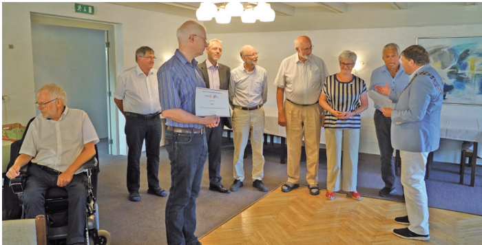
Rosenholm Rotary Klub fik på distriktsrådsmødet overrakt en Presidential Citation for deres projektarbejde, specielt i Indien.