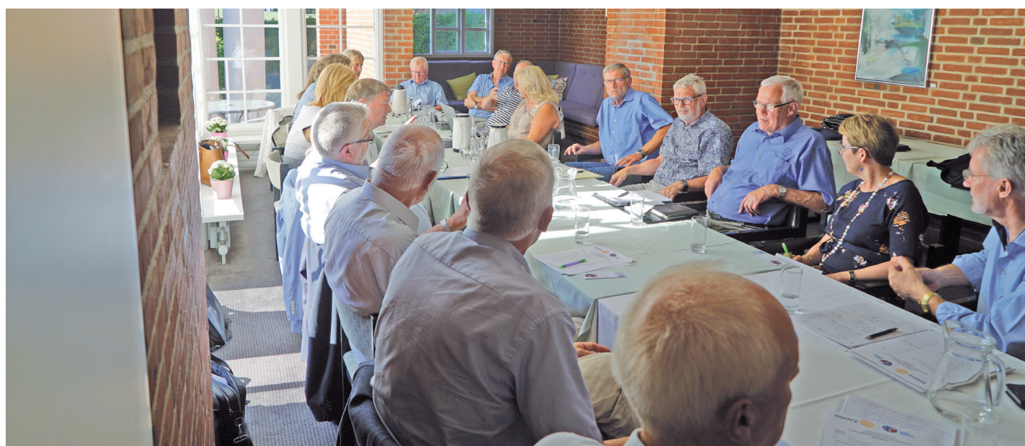
Distriktsrådet samlet på Rebildhus til årets sidste møde