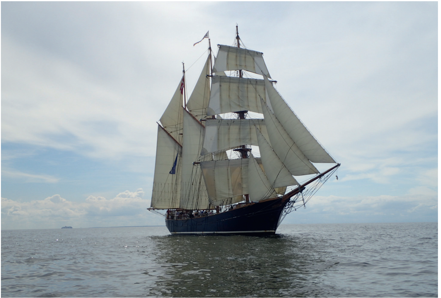
LOA set fra et af de andre skibe under en stagvending – hvilket er en udfordrende sag for en "råsejler".