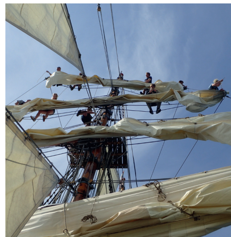
Sejlpasning på en barkentine som LOA kræver arbejde i riggen. For mange – men ikke de 4 studenter fra D1440 – er det en uovervindelig barriere at arbejde i riggen – op til 25 meter over vandoverflade