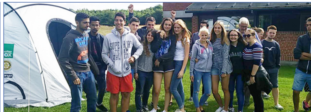
Stolte teltopstillere ...!