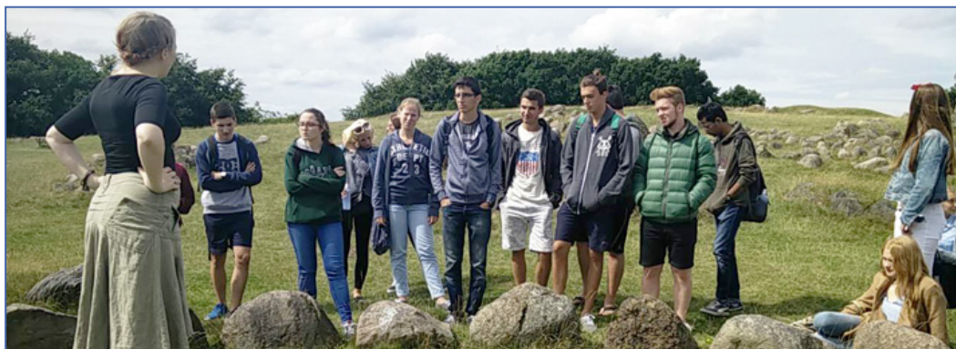
Guiden fortæller på Lindholm Høje.