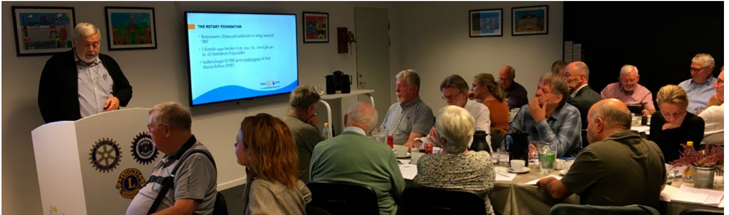
Udsnit af deltagerne ved Grant Management seminaret i Randers.

Mange af distriktets klubber har fokus på at gennemføre projekter og leve op til vores grundlæggende motto ”Service above self” – og med projektarbejde skabe sammenhold og aktivitet i klubben.