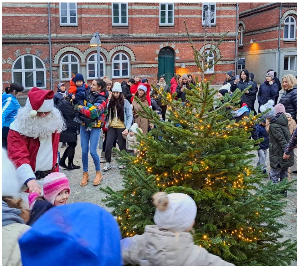
Juletræ og danske juletraditioner.