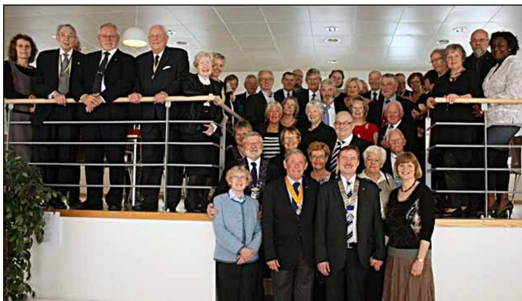
Til venstre: Det store gruppebillede ved Nørresundby Rotary Klubs 60-års fødselsdagsfest

For første gang med publikum, nemlig GSE nomineringsudvalget for D1440, fremviste de deres indlæg og fortalte om det på engelsk. Et flot veldisponeret program havde de sammensat, og det kan de og vi i D1440 med rette være stolte af, det bliver nogle gode repræsentanter for Rotary og de indstillende klubber at udsende. Vi ønsker dem en rigtig god tur til Australien og glæder os til at høre om deres tur undervejs, og når de vender tilbage!