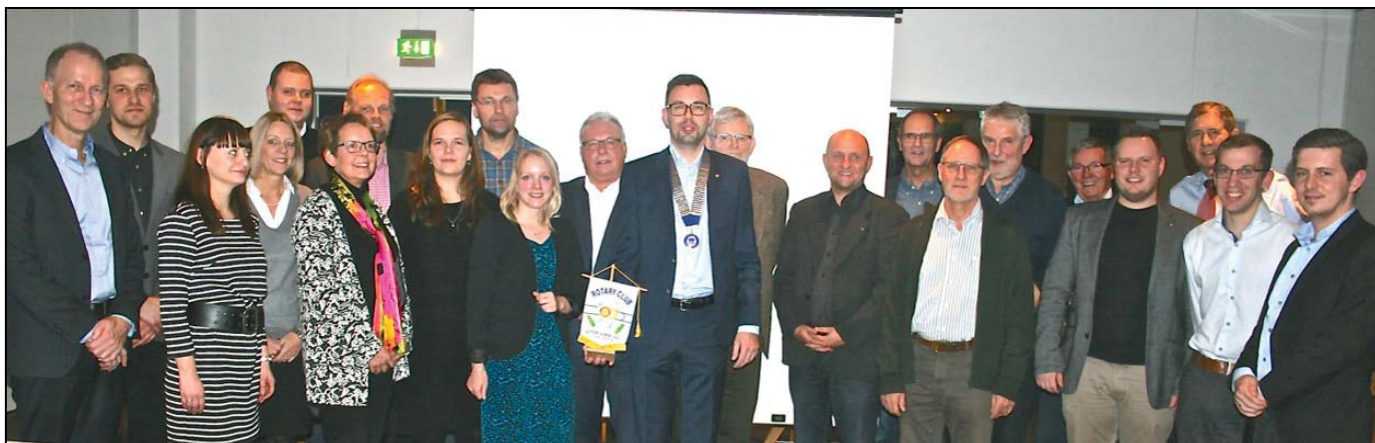
De mange gæster og foredragsholdere fyldte godt op på Aalborg Nørresundby Rotary Klubs åbent hus arrangement.