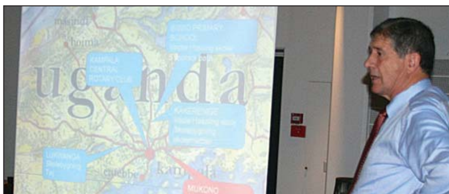
Øverst: Klubbens mangeårige medlem Anders Stenild fortalte med stor entusiasme om klubbens mange U-landsprojekter.