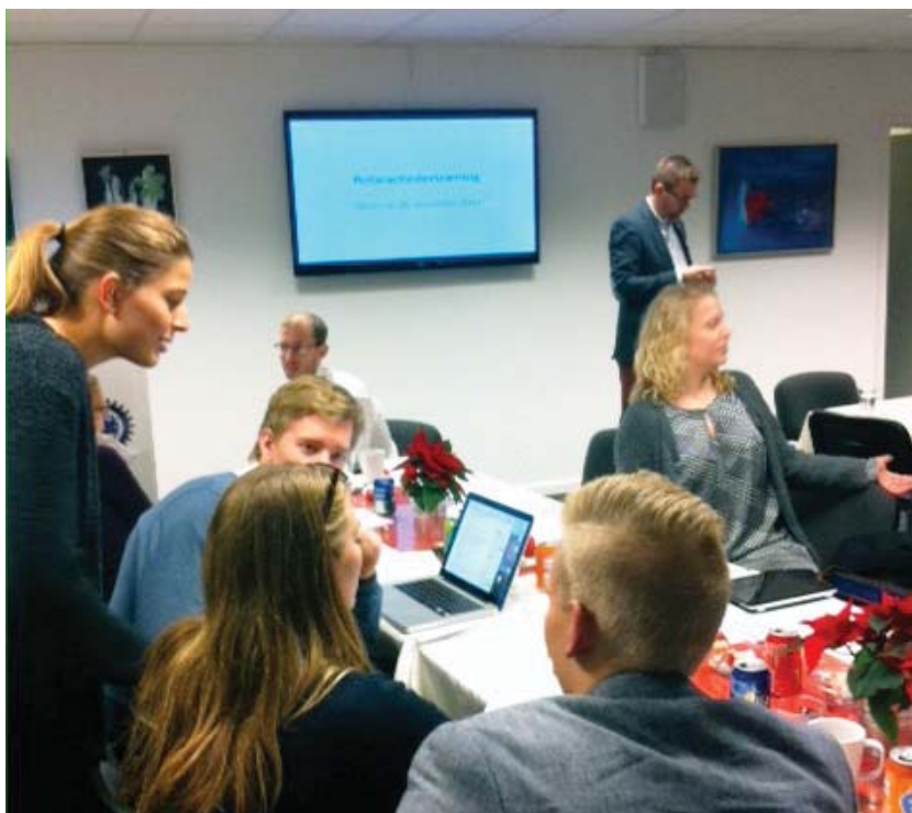
De tre seminarer er intensive, men der skal være plads til hygge og networking på tværs af klubberne