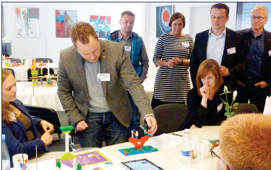
Der arbejdes i skiftende grupper på RLI