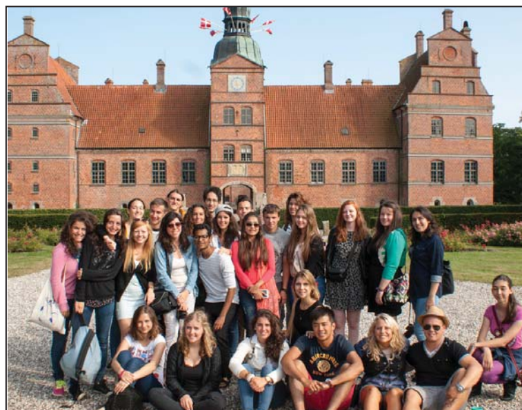
De unge var meget interesserede i Rosenholm Slot under den guidede tur i den gamle bygning.