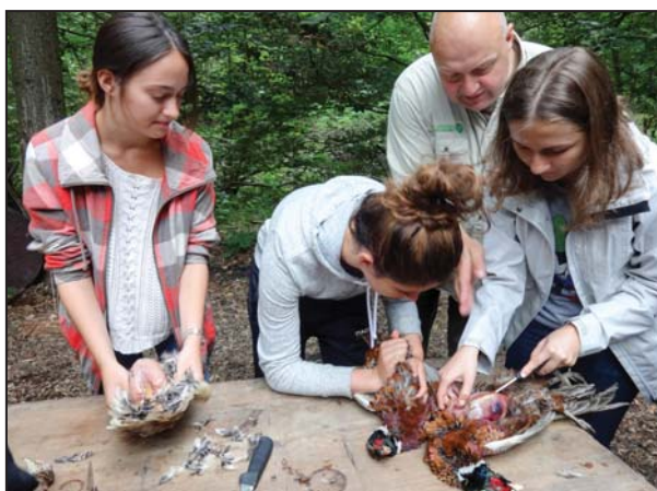
Der var en del skepsis over for opgaven med at tilberede fasanerne; men efter instruktionen fik især pigerne lyst til selv at prøve.

Udvekslingen, der varer 2-4 uger, finder som regel sted i skoleferier og indeholder sjældent egentlig undervisning. Ved deltagelse i disse lejre udvikles lederskab og bevidsthed om international forståelse.