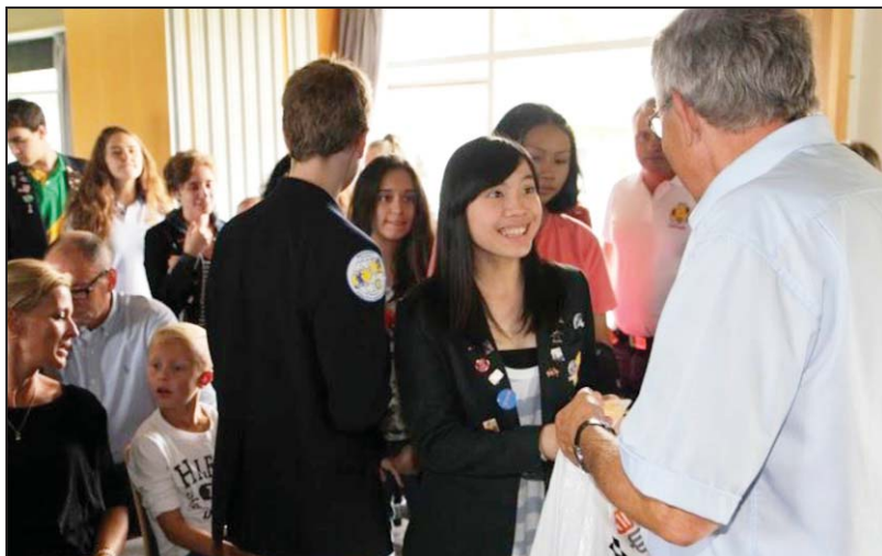
Troll - Mascot for distrikt 1440, uddeles til de nyankomne udvekslingsstudenter