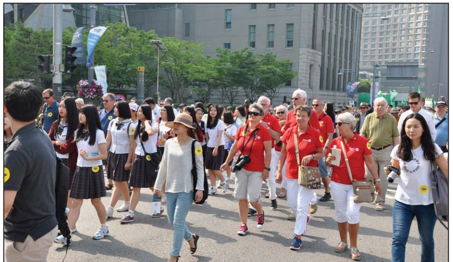
På fredsmarch i Seoul. Og 42.000 mennesker samlet i ét lokale! Det var stort – og gjorde indtryk.