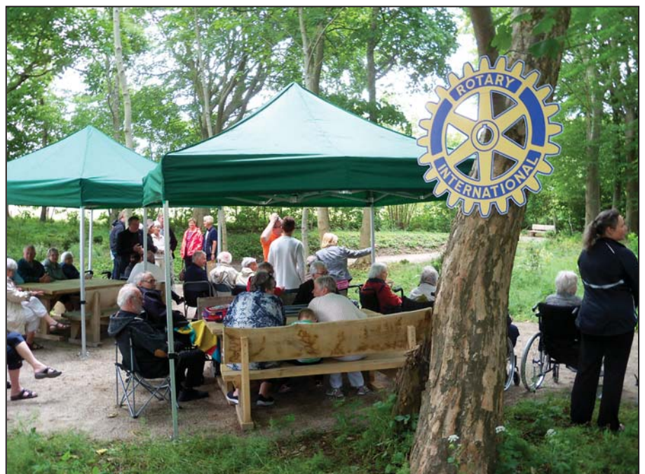
Hygge og god stemning ved indvielsen.

Et flot projekt – til glæde for Rotaryklubben, plejehjemmets beboere og indbyggerne i Pandrup.