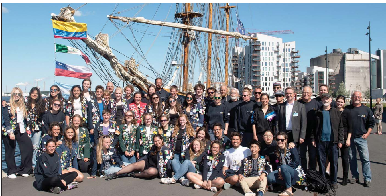
Øverst: Ved afslutningen sang udvekslingsstudenterne "Blæsten går frisk"... Nederst: Den samlede besætning ved ankomsten til Aalborg.