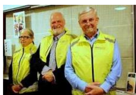
Store Heddinge RK, Trafikikkerhedsveste