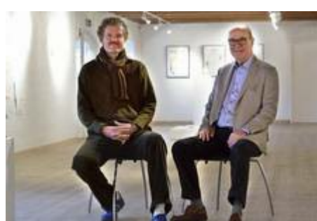
Hobæk RK, Kunst i Hobæk

Jeg håber, at jeg kan bringe mange flere eksempler på projekter i mit næste nyhedsbrev til inspiration for alle.