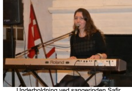
Underholdning ved sanginden Saffr