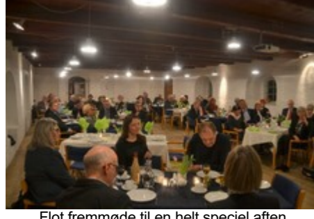
Fot fremmede til en helt spejel aften