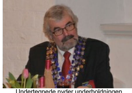
Underholdende hylder underholdningen