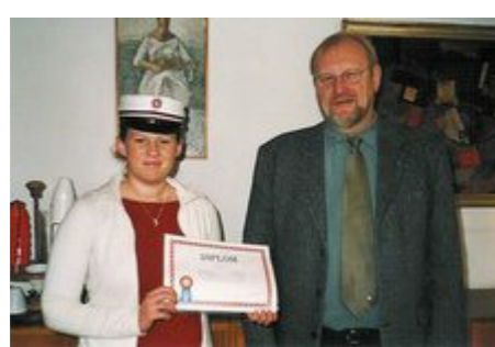
Kalundborg RK, Studenterhuse til udvekslingsstudenter