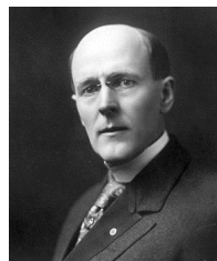
Paul Harris, Rotary Internationals stifter 19. april 1868–27. januar 1947

23. februar 1905 i Chicago. For bedre at forstå baggrunden for Rotarys stiftelse kan det være nyttigt at gå nogle år tilbage i tiden og se nærmere på Rotarys stifter, Paul Harris, hans barndom og opvækst samt voksen- årene før 1905.